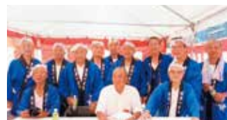
平瀬ダム定礎式にて

A 「平瀬ダムの定礎式で、何か披露してもらえないか」と民謡の会に依頼いただいたことがありました。錦に昔から伝わる『地搦き唄』を披露したのですが、『定礎式にぴったり!』と、とても喜んでもらえて、嬉しかったです。